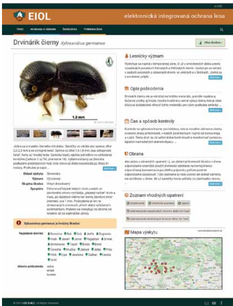
Obrázok 4. Karta škodlivého činiteľa Figure 4. A card of the pest.