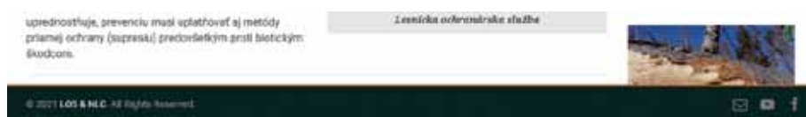
Obrázok 7. Pätička stránky s kontaktnými odkazmi Figure 7. Pätička stránky s kontaktnými odkazmi.

V pätičke stránky nájdeme aj odkazy na základné komunikačné kanály LOS, ako je sociálna sieť, archív zaujímavých a náučných videí a aj link na kontaktnú stránku, kde je možnosť poslať odkaz, dotaz či inú informáciu.