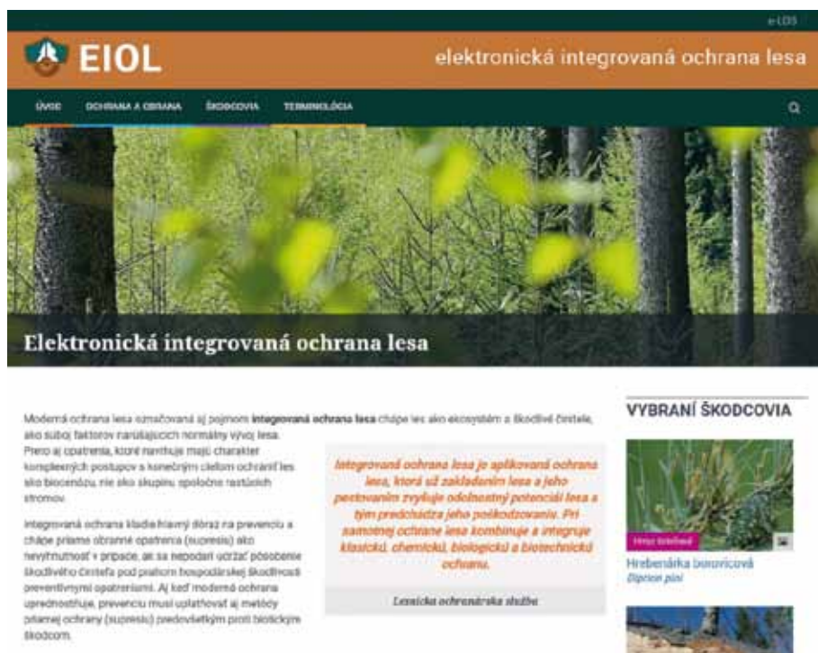
Obrázok 1. Úvodná obrazovka Figure 1. The introducing screen.

gentných mobilov. Našou reakciou na súčasný stav v tejto oblasti je vybudovanie nástroja elektronickej integrovanej ochrany lesa (EIOL).