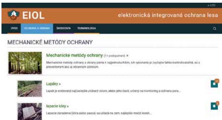
Obrázok 2. Zoznam opatrení s odkazom na zoznam škodcov pre konkrétne opatrenie Figure 2. The list of the measures with links to the list of pests considering specific measures.

Katalóg opatrení je ľahko prístupný z hlavného menu „OCHRANA A OBRANA“. Na stránke sú jednotlivé opatrenia rozdelené do kategórií, ktoré sa ďalej rozdeľujú podľa potreby na ďalšie podopatrenia.