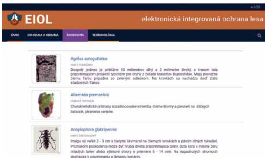
Obrázok 3. Zoznam škodcov zaradených v systéme EIOL Figure 3. The list of pests hierarchized in the EIOL system.

K zisteniu odporúčaných opatrení v systéme EIOL sa užívateľ dostane aj po identifikácii škodlivého činiteľa. Rýchla identifikácia a lokalizácia je len prvým krokom pri efektívnom zasahovaní proti škodlivým činiteľom v lesných porastoch. Aby sa minimalizovali následky agresivity škodlivého činiteľa na lesných drevinách je nevyhnutný rýchly zásah proti nemu (t. j. výber a použitie najvhodnejšieho spôsobu ochranného opatrenia).