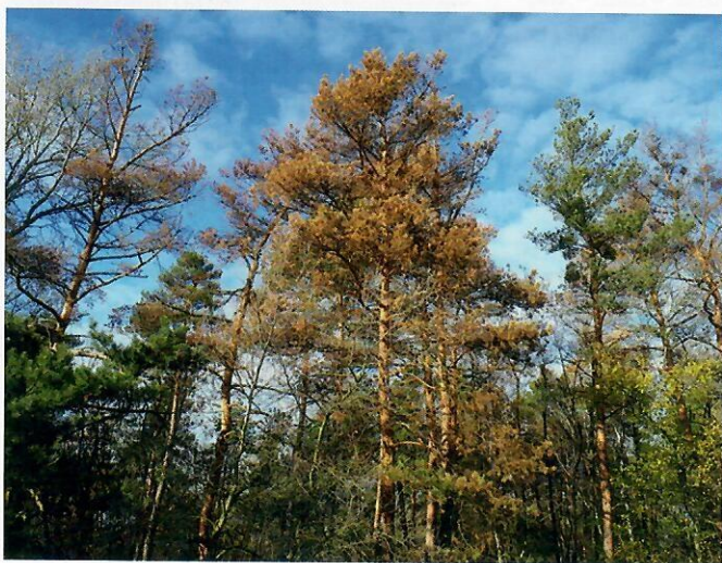
Borovicové porasty napadnuté lykožrútom vrcholcovým Ips acuminatus

Práca vznikla aj vďaka finančnej podpore v rámci operačného programu Výskum a vývoj financovaného z Európskeho fondu regionálneho rozvoja pre projekt ASFEÚ Progressive technológie ochrany lesných drevín juvenilných rastových štádií (ITMS 26220220120) . Táto práca bola podporovaná Agentúrou na podporu výskumu a vývoja na základe Zmluvy č.: APVV-15-0531, APVV-15-0348, APVV-16-0031. Tento príspevok bol podporený projektom „Výskum a vývoj na podporu konkurencieschopnosti slovenského lesníctva-SLOV-LES“, projekt financovaný z rozpočtovej kapitoly MPRV SR (prvok 08V0301). Projekt bol realizovaný s finančnou podporou Ministerstva obrany Slovenskej republiky.