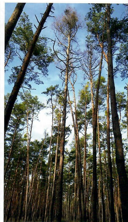
Napadnutie borovicových porastov na Záhorí imelom bielym

Odumieranie borovice spôsobené komplexným pôsobením sucha, podkôrneho hmyzu a húb nemožno podceňovať. V roku 2019 sa odumieranie začalo prejavovať aj v oblasti Spiša. Aj keď je borovica pomerne odolná a flexibilná drevína, dlhodobo oslabené stromy, ktoré majú krátke prírastky, preriedené koruny a poškodené korene nedokážu odolávať biotickým škodcom. Priaznivý vplyv počasia, najmä dostatok zrážok, môže posilniť stromy, ktoré by regenerovali a lepšie odolávali škodcom. Na tento fakt sa však v dnešných podmienkach klimatických zmien nedá spoľahnúť a preto je potrebné urobiť v aktívnej ochrane lesa čo možno najviac. Vzhľadom na pretrvávajúce klimatické zmeny