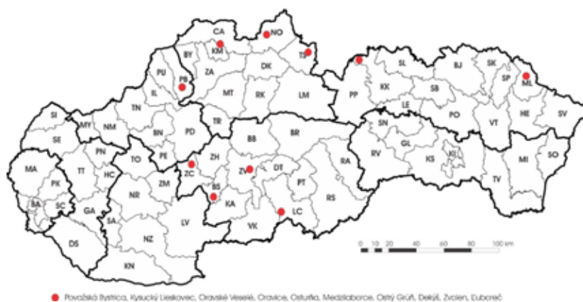
Obr. 3 Lokality s výskytom škôd spôsobených lykožrútom lesklým ako primárnym škodlivým činiteľom, alebo ako jedným z dominantných škodlivých činiteľov v mladých smrekových porastoch zaznamenaných v rokoch 2012 a 2013