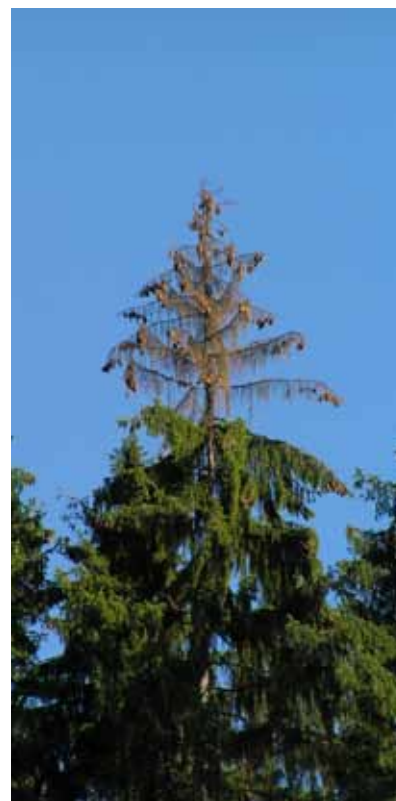
Obr. 5 Dospelý smrek, ktorý má vrcholec napadnutý lykožrútom lesklým