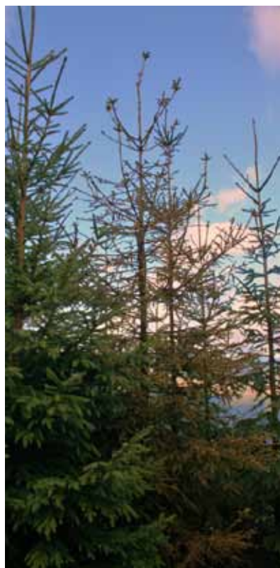
Obr. 4 Mladina napadnutá lykožrútom lesklým