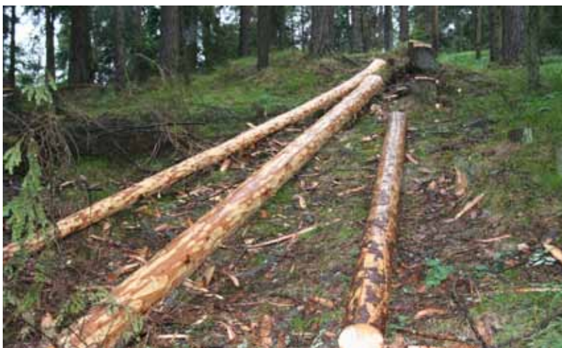
Obr. 9 Odkôrnené smrekové kmene nie sú atraktívne pre podkôrný hmyz

Trojnožka je forma otráveného lapáku, pri ktorej sa spájajú tri smrekové výrezy do trojnožky. Následne sa postriekajú insekticídny prípravkom, podloží sa plachtou pre kontrolu účinnosti a pod spoj výrezov sa zavesí feromónový odparník.