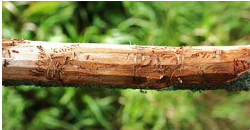
Obr. 6 Tenký smrekový konár napadnutý lykožrútom lesklým

Certifikácia lesa zvyčajne obmedzuje obhospodarovateľa vo využívaní všetkých metód ochrany v rámci princípov integrovanej ochrany lesa. Z tohto dôvodu nevyužívanie pesticídov môže spôsobiť nedostatočné asanovanie atraktívnej hmoty a vznik nových ohnisk podkôrneho hmyzu.