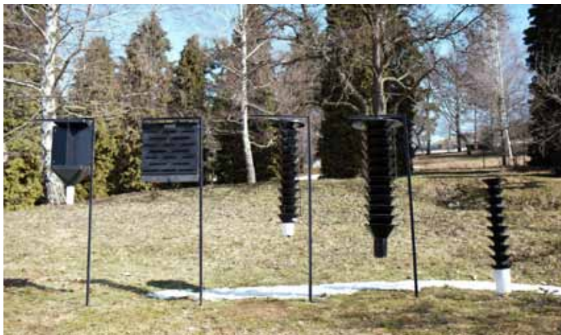
Obr. 7 Rôzne konštrukčné typy feromónových lapačov na podkórny hmyz: (zľava) Ecotrap, Theysohn, Lindgren funnel trap, Experimentálny prototyp, BEKA trap

Klasické lapáky sú jedným z najstarších spôsobov boja s lykožrútom lesklým, stále by však mali byť súčasťou systému ochranných a obranných opatrení. Ich najväčšou výhodou je možnosť umiestnenia priamo do porastu. Použitie a spôsob prípravy lapákov upravuje norma STN 48 2711. Za lapák na lykožrúta lesklého môžeme považovať takmer akúkoľvek atraktívnu hmotu od kmeňov, cez korunu až po hrubšie konáre sústredené na jednom mieste. Pri použití lapákov je však kľúčové správne načasovanie ich asanácie. Lapáky je nutné asanovať pred vyletením novej generácie a spôsob asanácie zvoliť podľa vývojového štádia lykožrúta lesklého. Pokiaľ sa v lapáku nachádzajú len larvy, môžeme takýto lapák mechanicky odkórniť. Odkórnenie však nepostačuje ak sú v lapáku žlté jedince alebo sú jedince v kuklovom štádiu. Vtedy je potrebné