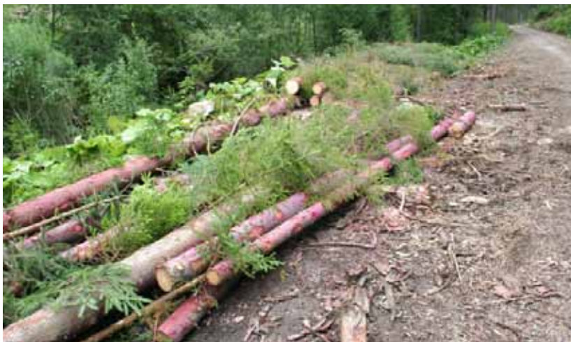
Obr. 8 Kmene smrekov na lesnom sklade využité ako otrávené lapáky

ako klasické lapáky, v tomto prípade však časti kmeňa, prípadne celý kmeň ošetríme autorizovaným prípravkom v koncentrácii stanovenej pre prípravu otrávených lapákov. Následne sa na kmeň umiestni feromónový odparník určený na odchyt lykožrúta lesklého. Pri príprave otrávených lapákov je potrebné dodržiavať všetky podmienky stanovene pre prácu a použitie pesticídov v lesníctve. Pre kontrolu, či je pripravený otrávený lapák účinný, môžeme pod lapák rozprestrieť textíliu (napríklad mulčovaciu plachtu), na ktorú budú padať uhynuté jedince. Veľmi efektívne je aj využiť hmotu na sklade, ktorá sa chemicky ošetrí a navnadí feromónom (obr. 8).