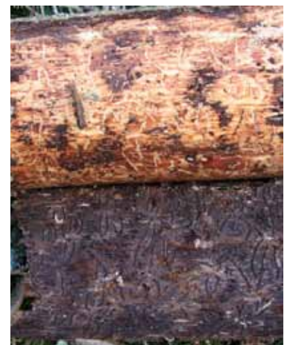
Obr. 2 Lykožrút lesklý vytvára v lyku charakteristický hviezdicovitý požerok