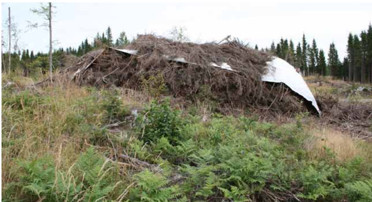
Obr. 10 Kopa zbytkov po ťažbe pripravená na štiepkovanie a prikrytá textíliou ako ochranou pred napadnutím lykožrútom lesklým

Štiepkovanie je veľmi efektívna metóda asanácie drevnej hmoty. Kmene a konáre vhodné pre vývoj lykožrúta lesklého sú počas štiepkovania rozdelené na menšie časti, ktorých veľkosť nie je dostatočná pre založenie novej generácie. Takéto čiastočky taktiež rýchlejšie presychajú, alebo dochádza k rýchlejšej degradácii lyka, ktoré je pre vývoj lykožrúta lesklého nevyhnutné. Výhodou štiepkovania je aj speňaženie hmoty, ktorá by za normálnych okolností zostávala v poraste.