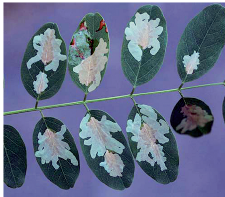
Obrázok 4. Psočka agátová ( Parectopa robinella Clemens)

Uvedený druh poškodzuje listy agáta bieleho. Pochádza zo Severnej Ameriky, odkiaľ bol náhodne introdukovaný do Talianska. Odtiaľ sa postupne šíril do ostatných krajín (Csóka 2003 in Kolár & Hrubík 2007). Na Slovensku sa zistil v roku 1989 (Kulfan 1989). Poškodzuje listy hlavne na listoch výmladkov a spodné partie stromu. Húsenica vytvára nápadné ploché lalokovité míny na hornej strane listov, prechádzajúce strednou žilkou listu. Druh má v našich podmienkach iba jednu generáciu a jedinou hostiteľskou rastlinou je agát biely.