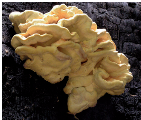
Obrázok 5. Sírovec obyčajný ( Laetiporus sulphureus )

Kohán (1998) uvádza, že veľkou výhodou agátového dreva je, že jeho spracovanie vyžaduje málo energie, má mimoriadne dobrú izolačnú schopnosť a je odolné voči hubovým chorobám a hmyzím škodcom. Z hubových škodcov však môže zdravotný stav agáta ovplyvniť najmä sírovec obyčajný ( Laetiporus sulphureus ), ktorý spôsobuje hnedú hnilobu, avšak znateľné symptómy v korune sa prejavujú až v pokročilom štádiu napadnutia, a to žltým sfarbením listov. Následkom napadnutia je rýchly rozklad jadrového dreva a vysoké nebezpečie zlomu. Z ostatných hubových škodlivých činiteľov možno uviesť ešte podpňovku obyčajnú, pórovník jaseňový a ohňovec hrbol'katý.