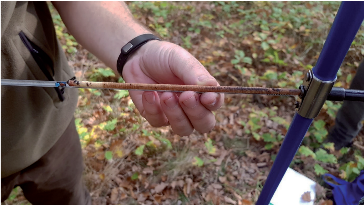
Obrázok 2. Detail kmeňového vývrtu