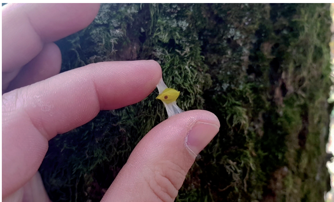
Obrázok 1. Lepkáva bobuľa imelovca európskeho

Imelovec európsky ( Loranthus europaeus Jacq.) je poloparazitický krík rastúci najmä na duboch. Na rozdiel od vždyzeleného imela bieleho ( Viscum album L.) je to opadavý krík. Územím Slovenska prechádza severná hranica jeho geografického rozšírenia v strednej Európe (Eliáš 2007). Pri väčšom napadnutí koruny významne ovplyvňuje vitalitu hostiteľa, ktorý znižuje prírastok až natoľko, že to môže viesť k úhynu. Má žlté, lepkavé plody, ktorými sa živia vtáky (Obrázok 1). Vektorom šírenia imelovca sú práve vtáky, najmä drozdy. V ich truse sa nachádzajú semenka imelovca, ktoré pri vhodných podmienkach vyklíčia.