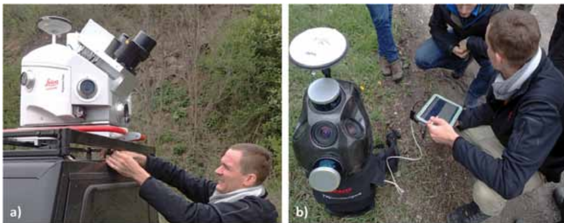
Obrázok 3. Technológia pozemného mobilného laserového skenovania: a) Leica Pegasus: Two; b) Leica Pegasus: Backpack Figure 3. Technology of mobile laser scanning: a) Leica Pegasus: Two; b) Leica Pegasus: Backpack.

Z dostupných informácií vyplýva, že v taxačnej praxi sa technológia MLS zatiaľ nevyužíva. Jej aplikačný potenciál v Európe ale podrobnejšie analyzuje skupina niekoľkých finských vedeckých a akademických inštitúcií spolupracujúcich v rámci „Centre of Excellence in Laser Scanning Research“ ( https://laserscanning.fi ). V tejto spolupráci bol skonštruovaný vlastný skenovací systém „ROAMER“, ktorý z väčšej časti pozostáva z unifikovaných zariadení tretích strán (Kukko et al. 2012). Z týchto dôvodov ani výskum zameraný na využitie technológie MLS v taxácii lesa nie je rozsiahly. Dostupné štúdie založené na dátach zo skenera, ktorý je nesený človekom ale preukazujú jasný aplikačný potenciál v tejto oblasti. Vyplýva z nich, že v závislosti od zvoleného plánu skenovania je týmto spôsobom možné zabezpečiť za jednu hodinu dáta z plochy až niekoľko sto metrov štvorcových. Podiel správne identifikovaných stromov na základe týchto dát môže následne dosiahnuť až 80 \pm 20\% . Celková chyba (RMSE%) zistenia výšky, hrúbky a objemu týchto stromov pritom s pravdepodobnosťou 68 % v určitých prípadoch dosahuje hodnotu 10 \pm 4\% , 9 \pm 4\% a 12 \pm 2\% (Hyypä et al. 2020).