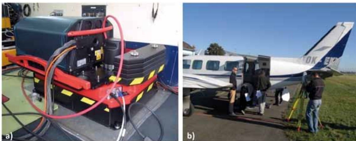
Obrázok 2. Technológia leteckého snímkovania a laserového skenovania: a) Leica ALS70-CM and Leica RCD30; b) Cessna 206 OK-EKT (Miková et al. 2020)