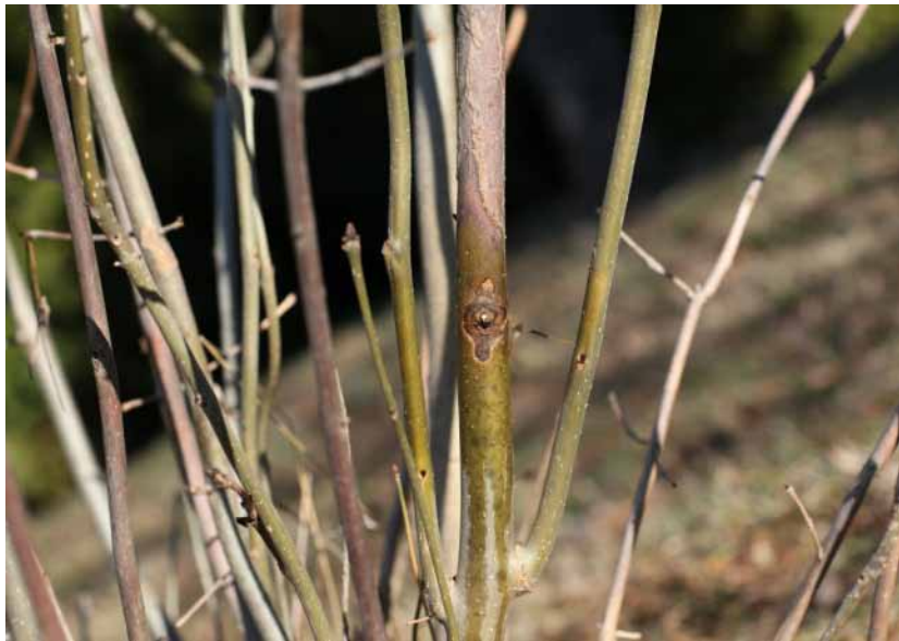
Obr. 4 Nekróza sa šíri od miesta pripojenia listu na výhonok