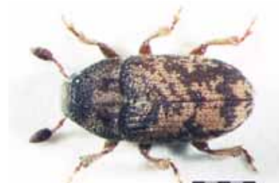
Obr. 9 Leperisinus fraxini – imág

Sekundárnymi škodcami sú lykokaz jaseňový Leperisinus fraxini (resp. lykokaz zrnitý Leperisinus crenatus v starších porastoch) a podpňovky Armillaria . Uvedené škodlivé činitele spôsobujú zrýchlené hynutie jaseňov napadnutých hubou Chalara fraxinea .