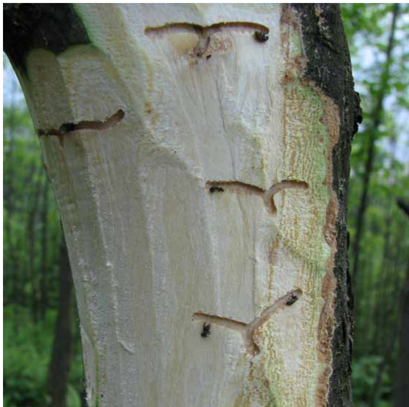
Obr. 13 Charakteristický požerok lykokaza jaseňového Leperisinus fraxini v tvare „letiacej vrany“