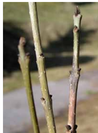
Obr. 2 Difúzne nekrózy výhonkov sú zvyčajne približne 5 – 10 cm pod terminálnym púčikom