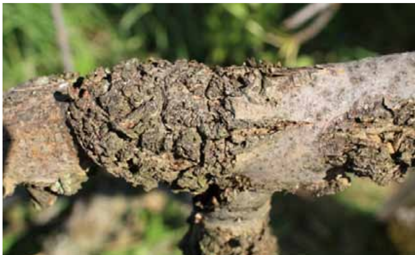
Obr. 7 Ružice na kmeni jaseňa, v ktorých prebieha zrelostný žer imág

Sekundárnymi škodcami sú lykokaz jaseňový Leperisinus fraxini (resp. lykokaz zrnitý Leperisinus crenatus v starších porastoch) a podpňovky Armillaria . Uvedené škodlivé činitele spôsobujú zrýchlené hynutie jaseňov napadnutých hubou Chalara fraxinea .