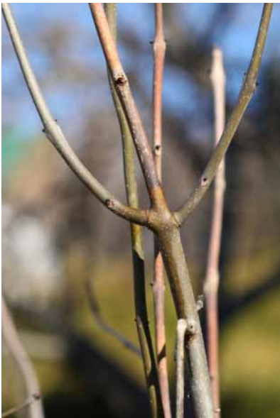
Obr. 3 Nekróza prostredného výhonku z praslenu