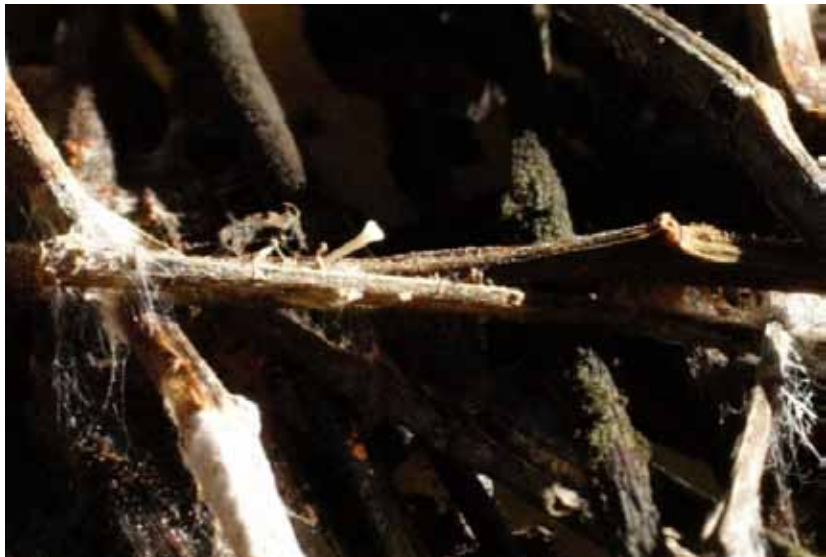
Obr. 5 Mladá plodnica Hymenoscyphus pseudoalbidus na listových stopkách 1 rok po infekcii listu

Patogénna huba rastie v letnom období na listových stopkách na zemi v opade z minulého roka. Askospóry sa vytvárajú v pohlavných plodničkách (diskomycéty) v júli a v auguste a sú rozširované do okolia vetrom. Nie je známe, prečo je patogén tak agresívny. Predpokladá sa však, že nie je pôvodný v Európe, ale pochádza z Ázie, kde sú stromy voči tomuto patogénu odolnejšie. Zdá sa, že huba Lambertella albida rastúca v Ázii v Japonsku na jaseň Fraxinus manschurica , je tá istá, ktorá je v Európe známa pod súčasným názvom Hymenoscyphus pseudoalbidus .