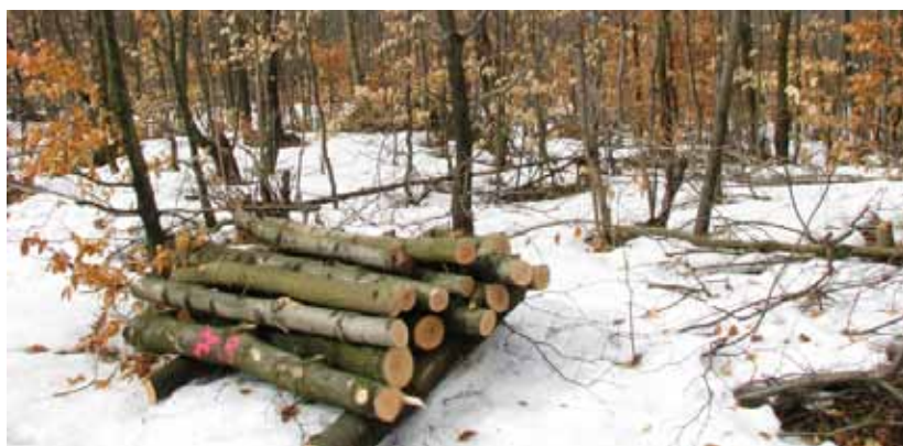
Obr. 15 Lapáky môžu byť umiestnené aj priamo do porastov