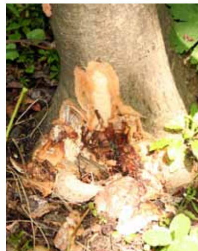
Obr. 10 Syrócium podpňovky Armillaria na päte kmeňa je častým sprievodným príznakom hynutia jaseňov