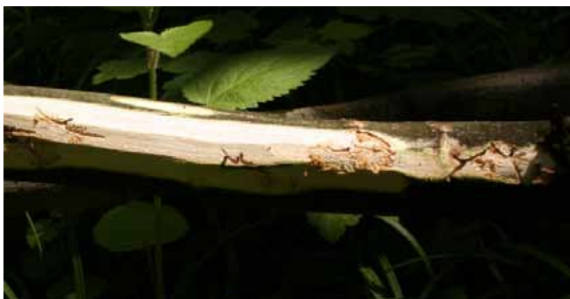
Obr. 17 Požerok Leperisinus fraxini s takmer ukončeným vývojom lariev