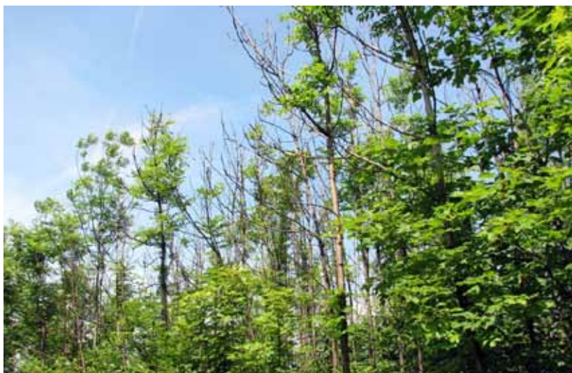
Obr. 1 Mladý porast s príznakmi hynutia jaseňov

v škólkach a vo výsadbách často zamieňa. Pod hnedým sfarbením kôry sú podkôrne pletivá už odumreté. Tieto nekrotické časti sú niekedy z okolitých pletív kalusované, avšak zvyčajne neúspešne. Pri dlhšom priebehu ochorenia (1 – 5 rokov) môžu byť na kmeni kvôli kalusovému pletivu vytvorené rakovinové rany. Častejšie dochádza k okružkovaniu a odumretiu celej časti nad miestom infekcie v prvom roku po infekcii.