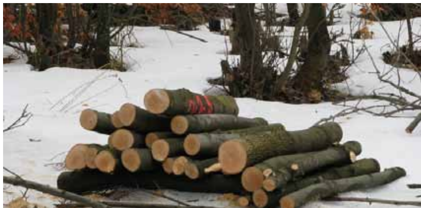
Obr. 14 Klasické lapáky pripravené do pyramídy ešte na konci zimy kvôli skorému rojeniu lykokazov

Na prevenciu a kontrolu populácie lykokaza jaseňového sa môžu vo vybraných porastoch so zastúpením jaseňa nad 30 % založiť lapáky. Ako lapáky je možné použiť mladšie až stredne staré jasene od hrúbky asi 10 cm. Prednostne vyberať netvárne napr. dvojáky, krivé alebo iné jedince nižšej kvality, ktoré by sme v najbližšom ťažbovom zásahu aj tak vybrali z porastu. Lapáky je potrebné pripraviť ešte v zimných mesiacoch, avšak najneskôr do konca februára. Následne počas doby rojenia (čo je pomerne skoro, začiatok od konca marca – apríl) kontrolovať stav napadnutia odkôrnením vzorkových plôšok, kde je potrebné si všímať hustotu materských chodieb. Naletené lapáky je potrebné včas (najneskôr v júni – júli, záleží od sledovania rýchlosti vývoja pod kôrou a od počasia), t.j. pred vyletením, vyvieť z porastov a následne zoštíepkovať, prípadne odkôrniť a kôru spáliť alebo chemicky ošetriť na odvoznom mieste. V porastoch, kde nebolo zatiaľ zistené napadnutie lykokazom, odporúčame pre kontrolu položiť 1 lapák na 3 ha.