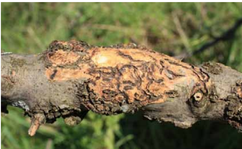
Obr. 8 Otvorená ružica