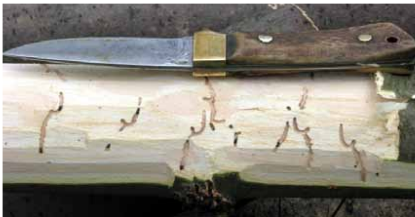
Obr. 16 Vývoj Leperisinus fraxini dňa 6. 5. – obdobie vhodné pre asanáciu lapákov

Najvýznamnejším predpokladom udržania lykokaza jaseňového na nízkej hladine početnosti je prísna porastová hygiena!