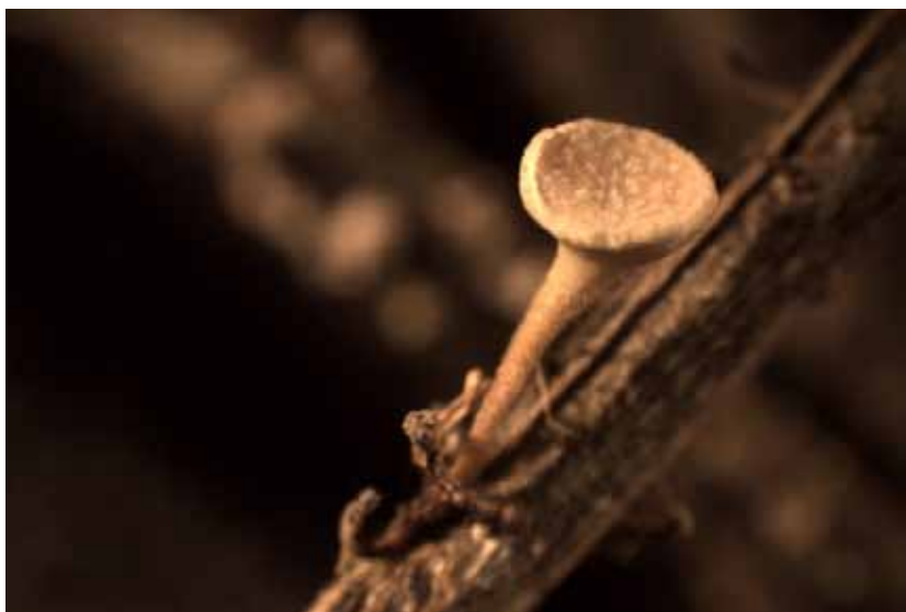
Obr. 6 Zrelá plodnica Hymenoscyphus pseudoalbidus