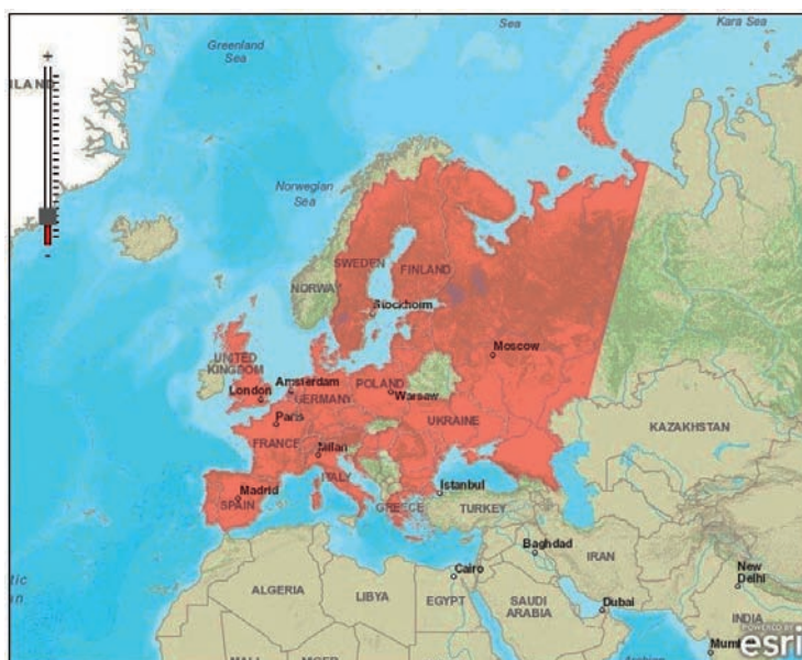
Obrázok 2. Výskyt javorovca jaseňolistého v Európe

V súčasnosti javorovec jaseňolistý predstavuje v ekosystémoch lužného lesa cudzí prvok a z hľadiska renaturácie i negatívny jav. Je rozšírený popri Dunaji a môžeme ho nájsť vo všetkých typoch lesných fytoocenóz inundačnej oblasti (Benčať et al. 1984). Uherčíková (2001) tiež konštatuje, že existuje priama súvislosť medzi hospodárením na veľkoplošných holoruboch a expanziou javorovca. Je to rýchlorastúca drevina, rastúca v listnatých lesoch, v lužných lesoch a v pobrežných porastoch.