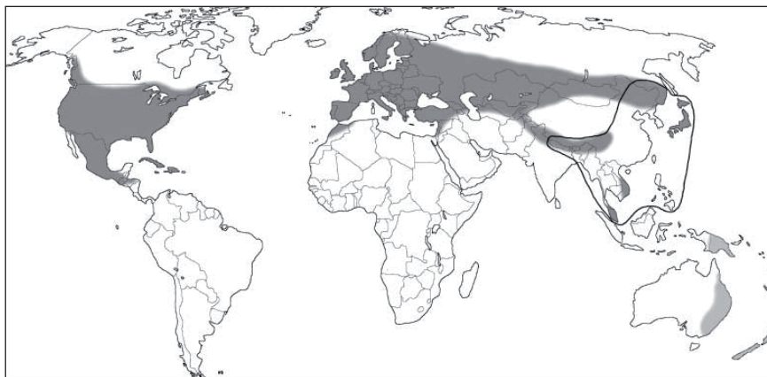
Obrázok 2. Globálne rozšírenie komplexu Heterobasidion s.l. (tmavo šedá plocha). H. araucariae (svetlo šedá plocha) a H. insular (čierno ohraničená plocha). KARI KORHONEN 2005

Vo svete je celkovo popísaných osem rôznych taxonomických druhov v rámci rodu Heterobasidion : H. annosum , H. parviporum , H. abietinum , H. araucariae , H. insular , H. pahangense , H. perplexum a H. rutilantiforme (NIEMELÄ a KORHONEN 1998) (obr. 2).