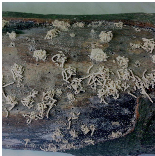
Obr. 1. Znaky prítomnosti drvinárika čierneho – kôpky bielej drviny vyhrzené samičkami v začiatkovej fáze poškodenia (vľavo) a vytlačené valčeky drviny v neskoršej fáze poškodenia (vpravo)