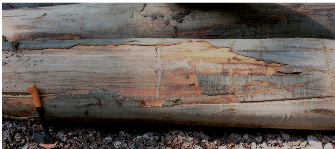
Obr. 3. Bukový výrez napadnutý drvinárikom čiernym na Slovensku

Čo sa týka celkového rozšírenia drvinárika čierneho na Slovensku, tak podľa poskytnutých hlásení z lesnej prevádzky a evidencie LOS je pravdepodobne rozšírený už na celom západnom Slovensku a približne do polovice stredného Slovenska (asi po Banskú Bystricu). Nové lokality výskytu rýchlo pribúdajú, takže predpokladáme, že sa nachádza aj v južnej polovici východného Slovenska. Šírenie prebieha pravdepodobne od juhu - juhovýchodu smerom na sever - severovýchod.