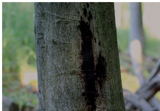
Obr. 2. Mokvajúce rany na kmeňoch bukov

Pod kôrou boli zistené požerky lykožrúta bukového ( Taphrorychus bicolor ), drevokaza bukového ( Xyloterus domesticus ) a požerky niektorých zástupcov čeľadí krasoňovitých (Buprestidae) a fúzačovitých (Cerambycidae). Početnosť chrobákov bola nízka. Zo zistených druhov chrobákov je najnebezpečnejší lykožrút bukový, ktorý by sa pri vytvorení vhodných podmienok mohol premnožiť a spôsobiť úhyn stromov. Pomerne početný bol výskyt technického škodcu drevokaza bukového, ktorý môže spôsobovať technické poškodenie dreva.