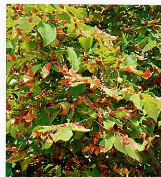
Obr. 11 Listy pagašťana napadnuté antraknózou pagašťanovou

časnosti, avšak poškodenie ploskáčikom pagašťanovým je tak silné, že hubové ochorenie uniká pozornosti. Význam ochorenia je najmä v lesných škôlkach, kde znižuje asimilačnú plochu a celkovú vitalitu semenáčikov a sadeníc a hlavne v parkoch, kde znižuje ich estetickú hodnotu. Príznaky sa prejavujú žltnutím, neskôr hnednutím listov od okraja, často sa vyskytuje súčasne s ploskáčikom pagašťanovým (Obr. 11, 12).