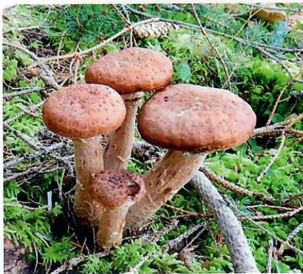
Obr. 1 Plodnice podpňovky smrekovej

Ide o jednu z najrozšírenejších húb našich lesov, ktorá sa vyskytuje nielen na smrekoch, ale aj na jedliach, boroviciach a iných drevinách. Na Slovensku je v posledných troch desaťročiach najvýznamnejším hubovým patogénom. Huba sa rozširuje spórami najmä po poranení, rizomorfy sa šíria pôdou a prenikajú cez poranenia koreňov, ako aj cez ešte neporanenú kôru a infikuje živé pletivá. My-