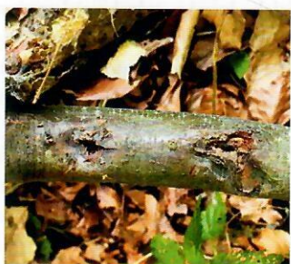
Obr. 8 Nekrázy na kôre buka