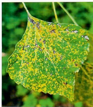
Obr. 9 Vrchná strana listu napadnutá hnedospórkou topoľovou

Na listoch topoľov sa koncom leta a v jeseni vytvárajú teliá a v nich teliospóry. Hrdza v tomto štádiu prezimováva na opadnutých listoch. Na jar teliospóry klíčia a vytvoria sa bazídiospóry, ktoré infikujú ihlice smrekovca. Na ihliciach sa potom vytvárajú spermogónia a kôpky oranžových ložísk – écií. Éciospóry infikujú listy topoľov, kde sa vytvárajú najprv žltoranžové urédiá, ktoré môžu opätovne v priebehu leta infikovať listy topoľov. Neskôr