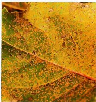
Obr. 10 Spodná strana listu napadnutá hnedospórkou topoľovou

sa na listoch vytvárajú zimné spóry teliiospóry v tmavohnedých až čiernych ložiskách zimných spór - teliách. Listy osiky sú napádané podobnou hrdzou M. laricis-tremulae . Ochorenie na smrekovcoch nemá praktický význam. Príznaky napadnutia topoľov sú viditeľné zďaleka, asimilačné orgány postupne hnednú, na listoch sa vytvárajú hrdzavé bodky na oboch stranách (Obr. 9, 10).