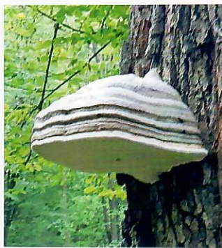
Obr. 5 Plodnica práchnovca kopytovitého