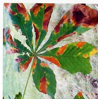
Obr. 12 List napadnutý antraknózou pagašťanovou