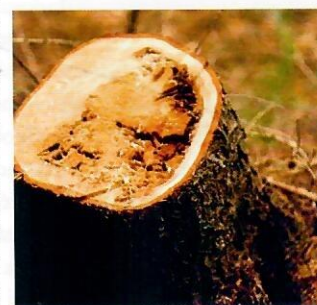
Obr. 4 Napadnutý kmeň

mycélia. Je jedným z najvýznamnejších patogénov koreňov stromov, zvlášť po prebierke v druhej generácii porastov založených na bývalých lúkach a pastvinách. Pri obnove porastu sa odporúča aj zmena drevinového zloženia s vyšším zastúpením listnáčov. Ďalej je potrebné udržiavať hygienu porastov a podľa potreby aj znížiť rubnú dobu. Sú dva hlavné spôsoby infekcie živých stromov koreňovkou vrstevnatou. 1. Výtrusmi, ktoré sa uvoľňujú z plodníc a vzdušnými prúdmi sú vnášané do poranení na kore-