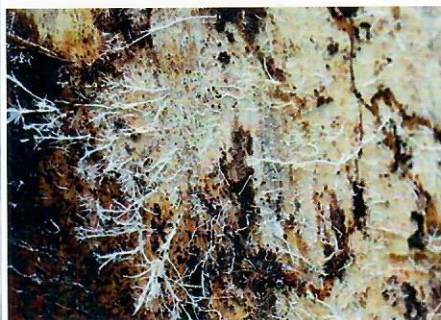
Obr. 2 Biele syrúciá podpňovky smrekovej

célium spôsobuje bielu hnilobu dreva, ktorá sa môže lúčovito šíriť do jadrového dreva. Medzi hnijúcim a zdravým drevom sa vytvára čierna pseudosklerózná vrstva, dobre viditeľná na pričnom reze. Pri šírení sa syrúcia pod kôrou strom produkuje nadmerné množstvo živice, ktorá vyteká na povrch. Pri šírení sa hniloby cez beľové drevo smerom ku kambiu, môžu vznikáť hrče a vnútorné rakoviny, resp. fľaškovitý tvar kmeňa. Stromy odumierajú v skupinách. Príznaky napadnutia sú viditeľné pod kôrou, ide o biele povlaky a povrazcovité útvary, zdurenie (fľaškovitý tvar) kmeňa, na jeseň prítomnosť plodníc na koreňových nábehoch, kmeni a pňoch, ako aj v okolí napadnutých stromov (Obr. 1, 2).