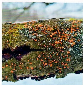
Obr. 7 lodnice hlivky šarlátovej

v oblasti Strážovských vrchov, Magury, Slovenského Rudohoria, Slánskych vrchov, Vihorlatu a inde. Najintenzívnejšie plošné poškodenie bukových mladín sme na Slovensku zaznamenali v 90. rokoch minulého storočia. V súčasnom období sa ochorenie vyskytuje lokálne, najmä po suchých rokoch. Medzi výrazné príznaky poškodenia bukov zaraďujeme prítomnosť drobných červených hrboľčkovitých plodničiek na kôre kmeňov a na vetvách (Obr. 7, 8).