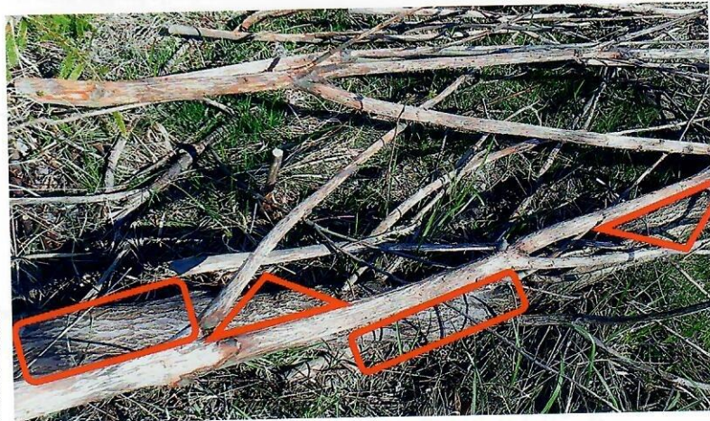
Foto 1 Na čerstvo spílených ohryzových drevinách (v tomto prípade rakyty) nachádza jelenia zver významný a ľahko dostupný potravinový zdroj. Avšak v prípade ležaniny, vzájomne nakopenej, je prekrytý povrch kmeňa na obhryz kôry horšie dostupný, vid'. segmenty kmeňa bez obhryzu vyznačené červenou farbou.

Treba si uvedomiť, že spílením stromu sa prístupňuje aj tá jeho časť, na ktorú zver pred spílením nedosiahne. Pokiaľ ide o jeleniu zver, týka sa to vzdialenosti od úrovne pôdy približne nad 2 metre. Ležiaci strom sa zveri obhryzá pohodlnejšie ako stojaci strom (horizontálna plocha verzus vertikálna). V prípade konárov je komfort odhryzu približne rovnaký, spílením sa len zvyšuje množstvo prístupných konárov. Na druhej strane spílený strom poskytuje zveri potravu len relatívne krátke obdobie, konkrétne pokým konáre a kôra nezaschnú. Naše zistenia