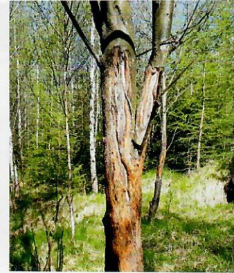
Foto 2 Rakyta (foto vľavo) a taktiež osika sú na obhryz kôry citlivejšie než jarabina vtáčia (foto vpravo). Kým intenzívne obhryzená rakyta, resp. osika presychá, jadro popraská až nakoniec odumrie, tak jarabina obhryz relatívne dlhodobo znáša a rany postupne zavaluje.

hraditeľné funkcie. Treba s nimi hospodáriť prezieravo (najmä v rámci výchovných zásahov), a pritom ich úlohu nepodceňovať, ale ani nemať prehnané očakávania.