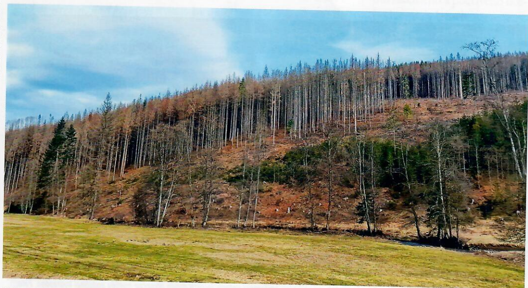
Obrázok 3 Plošné napadnutie porastov lykožrútom smrekovým na Horehroní v roku 2024.

Práca vznikla vďaka finančnej podpore v rámci projektov APVV-19-0116, APVV-22-0399 a APVV-22-0545, projektu "PROMOLES" - projekt financovaný z rozpočtovej kapitoly MPRV SR a projektu LignoSilva [Grant Agreement #101059552] podporenom Európskou komisiou v rámci Horizon Europe Teaming for Excellence action.