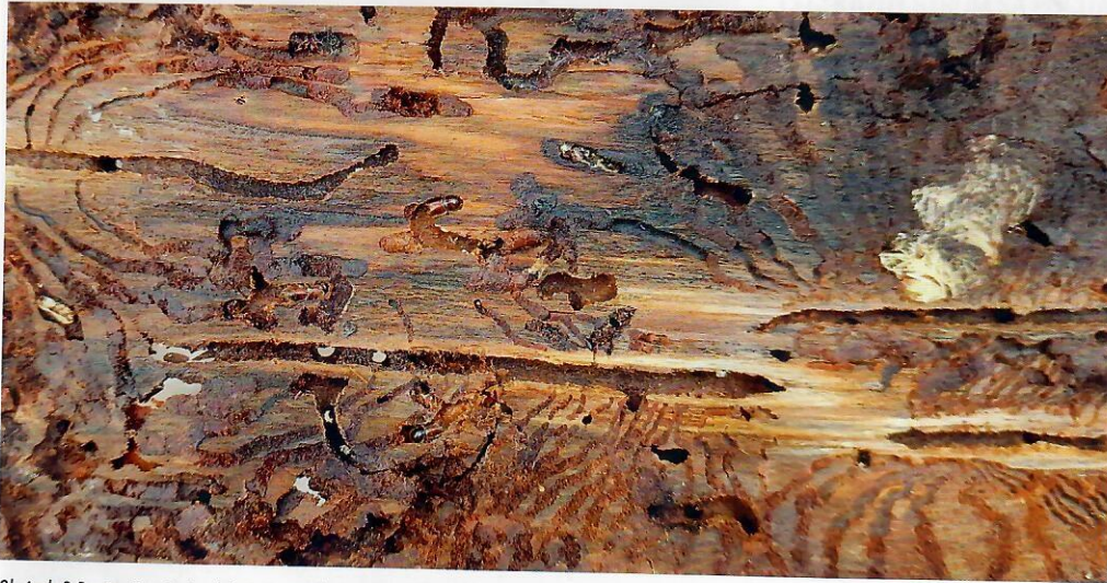
Obrázok 2 Prezímujúce imága lykožrúta smrekového v požerkoch, pripravené na jarné rojenie.

zimného klúdu (dormancie), čo môže pôsobiť pre dreviny stresujúco. Nadpriemerne vysoké teploty spôsobujú vysoký výpar a napr. už vo februári 2024, napriek vysokým úhrnom zrážok bolo zaznamenané na polovici územia Záhoria začínajúce meteorologické suchu. Toto je problém týkajúci sa celého vegetačného obdobia, kedy sa nám dlhodobo zrážky nemenia, ale vyššie teploty zapríčiňujú väčší výpar a vznik sucha. Samozrejme na suchu významne vplyva aj distribúcia zrážok počas roka. Nedostatok snehových zrážok v horských polohách spôsobuje, že voda sa z povrchových častí pôdy rýchlo odplaví a stromy môžu v jarných mesiacoch trpieť suchom. Ide najmä o smrekové porasty, ktoré sú v súčasnosti najviac poškodzované podkôrnym hmyzom.