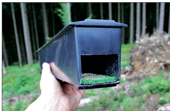
Obrázok 4. Nosič s aplikovaným prípravkom Boveril a výletový otvor (OZ Námestovo)