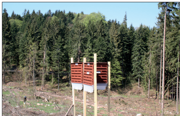
Obrázok 5. Trojitá zostava lapačov Multiwit BK hviezdice

Použitie boli trojité zostavy feromónových lapačov Multiwit BK (tzv. hviezdice) navnadené odparníkom IT Eco-lure Extra (obr. 5). Použitý bol jeden odparník do jednej trojitej lapačovej zostavy, ktorý bol umiestnený v strede. Zostavy boli postavené striedavo vo vzdialenosti 20 – 25 metrov od porastovej steny dlhej 350 metrov, s rozstupom medzi jednotlivými zostavami 30 metrov. Použitých bolo spolu 15 lapačov Multiwit BK (5 zostáv hviezdice) a ďalších 18 lapačov Ecotrap (6 zostáv trio). Zostavy Ecotrap neboli infikované, slúžili výhradne na odchyt lykožrúta smrekového.