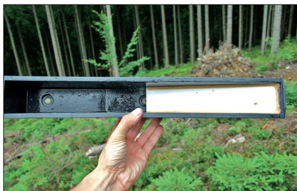
Obrázok 3. Upravená zberná nádoba lapača Theysohn (OZ Námestovo)