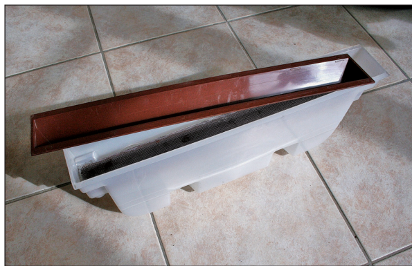
Obrázok 1. Upravená zberná nádoba lapača Multiwit BK s odtokovým kanálom