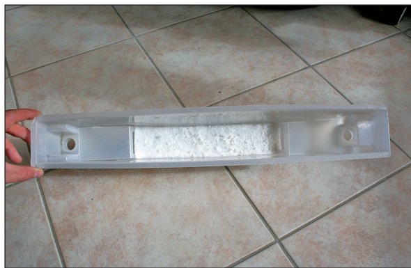
Obrázok 2. Inokulačná vložka s Boverolom v zbernej nádobe lapača Multiwit BK