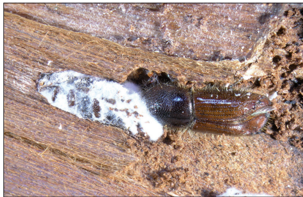
Obrázok 6. Imága lykožrúta smrekového porastené mycéliom huby Beauveria bassiana