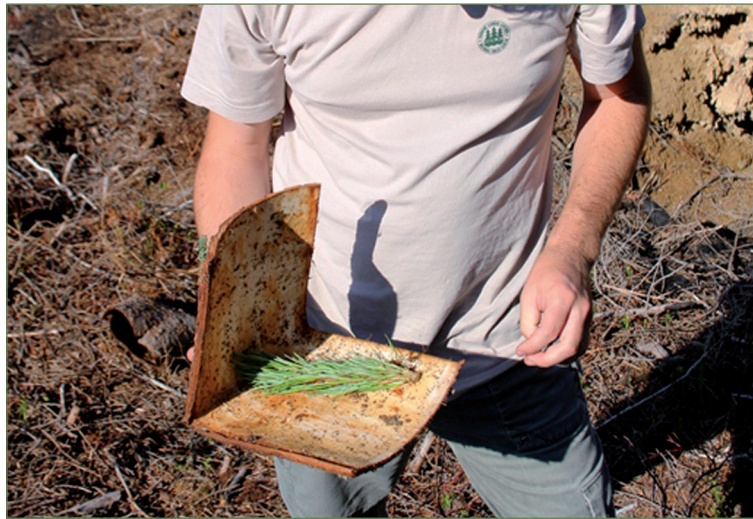
Obrázok 3. Optimálny tvar prelozenej lapacej kôry (pracovník LOS pri kontrole kôry)

Pracovníci LOS v roku 2011 vypracovali „ Usmernenie ku kontrole, ochrane a obrane sadeníc pred poškodením tvrdoňom smrekovým Hylobius abietis a lykokazom sadenicovým Hylastes cunicularius “, ktoré je dostupné na stránke www.los.sk , a ktoré bude v prvej polovici roka 2012 aktualizované aj o tieto zistenia a odporúčania pre lesnícku prax. Uvedené usmernenie odporúčame preštudovať najmä tým odborným lesným hospodárom, ktorí realizovali výsadby ihličnatých sadeníc v posledných dvoch rokoch a odporúčame vykonať minimálne terénnu obhliadku zdravotného stavu sadeníc s dôrazom na poškodenie od tvrdoňov smrekových.