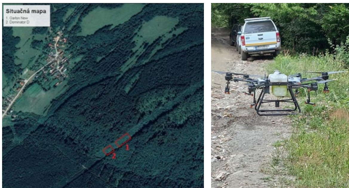
Obrázok 1. Situačný náčrt Magnezitovce a aplikačný dron Figure 1. Map of Magnezitovce and dron

Odstraňovanie Agátu bieleho pod elektrovodmi sme vykonali v lokalite Magnezitovce. Situačný náčrt lokality ilustruje obrázok 1.