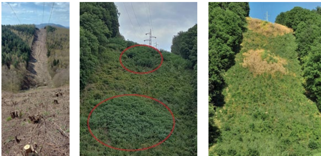
Obrázok 2. Priestor pod elektrovdmi po čistení 2021, pred čistením 2022 a po čistení 2022 Figure 2. The space under the power lines after cleaning in 2021, before cleaning 2022 after cleaning in 2022