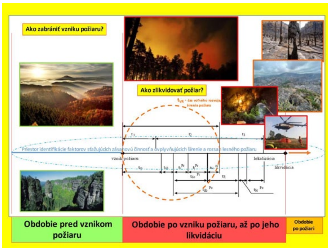
Obrázok 1. Priestor identifikácie faktorov sťažujúcich zásahovú činnosť a ovplyvňujúcich šírenie a rozsah lesného požiaru Figure 1. Area for identification of factors complicating intervention activities and influencing the spread and extent of forest fires

ovplyvňuje aj tvorbu právnych predpisov. Najčastejšou príčinou sú tzv. „spoločenské zmeny“ po roku 1989, realizované cez programové vyhlásenia vlády. Tieto so sebou prinášajú striedanie vrcholového manažmentu podľa politických preferencií (Lesy SR, š.p. BB, NLC Zvolen, Správa TANAP -u, ale aj HaZZ), ale aj organizačné zmeny. Z dôvodu úpravy vlastníckych vzťahov k pôde, ale aj privatizácie, štátny podnik Lesy SR, so sídlom v Banskej Bystrici ešte v roku 1999 riadil 26 OLZ a 2 špecializované závody, identifikovateľné podľa sídla riaditeľstva (O nás, 2022), v roku 2022 to je už len 12 OZ a 2 špecializované závody, s názvom pohoria, alebo regiónu. Podobný problém, pri aplikácii programového vyhlásenia vlády má aj HaZZ, kde sa výmena manažmentu spravidla začína minimálne od riaditeľa KR HaZZ.